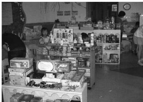
⑧ 创设仿真实情境，激发幼儿参与现实情境“儿童超市”