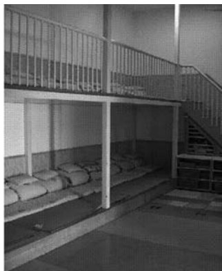
③ 午休室通过双层设计增加童趣性

②创设生动的情境性环境，渲染主题气氛，激发幼儿参与主题、探索主题的欲望。让儿童走进真实情境，激发幼儿主动探究的欲望。在情境中让幼儿扮演各种角色，促进幼儿的社会性发展。——照片③