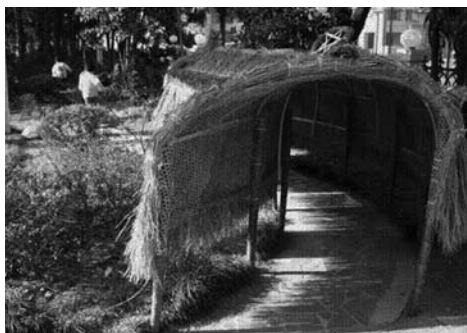
⑥ 充满野趣的室外空间