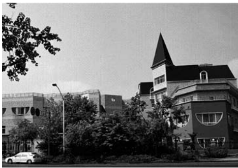
杭州幼儿师范学院附属幼儿园