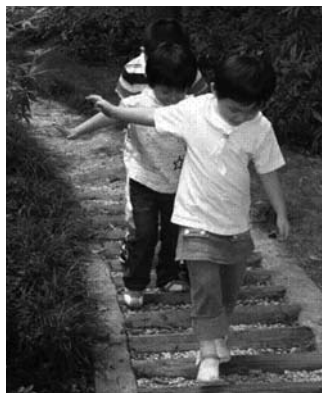
④ “不平路”既满足了幼儿挑战、猎奇的需要，又促进幼儿脚底血液循环和感知能力的发展。