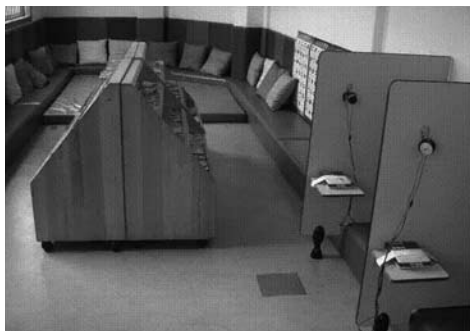
① 巧妙进行颜色调配，产生相似、对比效应

空间，错层的活动空间，通过小楼梯、娃娃家、阁楼的读书区、建构区增强立体性，通过移动床、移动柜子、移动书架、移动画架增强空间的变化性。